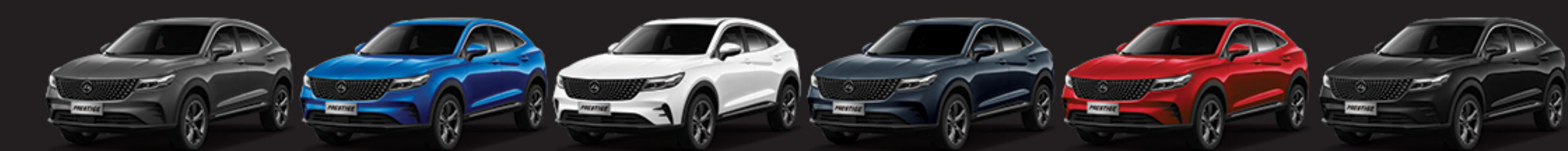
مشکی یاقوتی Sapphire Black | قرمز روناسی Ronass Red | سفید دماوندی Damavand White | آبی اطلسی Atlantic Blue | خاکستری کوهستانی Galaxy Grey | خاکستری گرافیتی Graphite Grey

سانروف پانوراما به همراه سیستم ایمنی تشخیص مانع